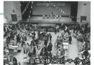
会場全はとフリーマーケット

「国籍を超えて、みんながお互いに気持ちよく生活できる岡崎市をめざして」をスローガンに、岡崎市に在住するブラジル、中国、フィリピン等、外国人市民の皆さん、そして日本の皆さんが、それぞれの国の様々な文化にふれあい、お互いの理解と交流を図るイベントとして、岡崎市国際交流協会とともに開催しています。各国の紹介ブースとともに、様々な国のパフォーマンスを楽しんでいただき、人と文化の交流を目指しています。そのために、一昨年度よりフリーマーケットも開催し、いろいろな国の皆さんとの交流が生まれています。