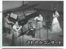
さわやかコンサート

そして、平成24年度からは、「こどものためのコンサート」が始まりました。それは、平成24年3月の岡崎市児童センター「太陽の城」閉館に伴って、それまでここで開催されていた岡崎音楽家協会のメンバーによる「こどものためのコンサート」が幕を閉じることになってしまったからです。せっかく長く続けられてきたこのコンサートを何とか存続させたいと考え、甲山会館で新たなスタートしていただきました。今年度で6回目の開催となります。