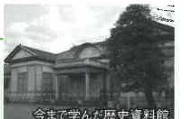
今まで学んだ歴史資料館

歴史の町「岡崎」には、普段なにげなく見ている風景の中にも、知らなかつたり気づかなかつたりする歴史があります。そんな身近なところから、ふるさとを見つめ直してもらいたいという願いから始まりました。資料を通して学ぶだけでなく、現地に足を運んで実際の姿を見たり、昔の面影を偲んだりしながら、五感で学ぶことを大切にする歴史教室です。毎日の生活の中で、ふるさと「岡崎」を意識し、これからも愛してもらいたいという願いが込められています。