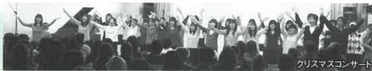
クリスマスコンサート

気軽に質の高い音楽を親子で楽しんでもらいたいという願いと、地元や近隣の大学、そして市内の音楽家の皆さんに活躍の場を提供したいという思いで平成21年から始まった「親子で楽しむコンサート」。「クリスマスコンサート、New Yearわくわくフレッシュコンサート、バレンタインコンサート、さわやかコンサート」と、年毎に名前は変わっても、同じコンセプトのもと、様々な内容で開催してまいりました。