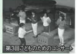
第3回こどものためのコンサート

そして、平成24年度からは、「こどものためのコンサート」が始まりました。それは、平成24年3月の岡崎市児童センター「太陽の城」閉館に伴って、それまでここで開催されていた岡崎音楽家協会のメンバーによる「こどものためのコンサート」が幕を閉じることになってしまったからです。せっかく長く続けられてきたこのコンサートを何とか存続させたいと考え、甲山会館で新たなスタートしていただきました。今年度で6回目の開催となります。