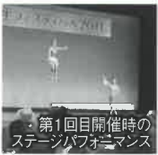
第1回目開催時のステージパフォーマンス

「国籍を超えて、みんながお互いに気持ちよく生活できる岡崎市をめざして」をスローガンに、岡崎市に在住するブラジル、中国、フィリピン等、外国人市民の皆さん、そして日本の皆さんが、それぞれの国の様々な文化にふれあい、お互いの理解と交流を図るイベントとして、岡崎市国際交流協会とともに開催しています。各国の紹介ブースとともに、様々な国のパフォーマンスを楽しんでいただき、人と文化の交流を目指しています。そのために、一昨年度よりフリーマーケットも開催し、いろいろな国の皆さんとの交流が生まれています。