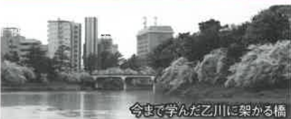
今まで学んだ乙川に架かる橋

歴史の町「岡崎」には、普段なにげなく見ている風景の中にも、知らなかつたり気づかなかつたりする歴史があります。そんな身近なところから、ふるさとを見つめ直してもらいたいという願いから始まりました。資料を通して学ぶだけでなく、現地に足を運んで実際の姿を見たり、昔の面影を偲んだりしながら、五感で学ぶことを大切にする歴史教室です。毎日の生活の中で、ふるさと「岡崎」を意識し、これからも愛してもらいたいという願いが込められています。