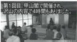
第1回目、甲山閣で開催され、沢山の内容で4時間もありました。

リニューアルでコンサートの形は変わりましたが、かける願いはそれまでと変わることなく、子どもたちに本物の音楽を聴かせてあげたいという、熱い思いで創りあげるコンサートです。また、それと同時に、地元の岡崎音楽家協会の皆さんを応援するコンサートでもあります。