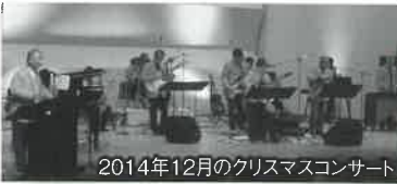
2014年12月のクリスマスコンサート