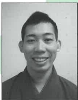
二つ目 / 三遊亭けん玉 (さんゆうてい けんたま)