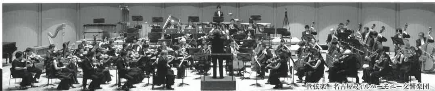
管弦楽 名古屋フィルハーモニー交響楽団