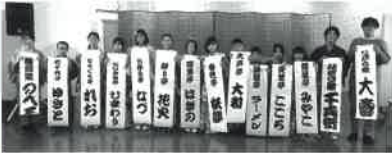
※昨年度の落研寄席の様子

若者たちの発表の機会を多くもって もらいたいという願いで始まった落研 寄席も、第1回を甲山閣で開催して以 来、今年で9回目を開催することになり ました。本年度は、会場を甲山会館に 移動して、より楽しんでいただくこと ができると思います。小学生と大学生 が、それぞれの持ち味を活かして、精 一杯頑張る姿をご覧ください!