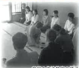
前回の作法教室の様子

落ち着いた和の施設「甲山閣」での作法教室です。今回は、ゆかたで茶席における基本の作法やお茶をいただくときの作法や食事のいただき方などを学びます。知識だけでなく体験することで、あなたの普段の生活の何気ない仕草の中で生きることでしよう。