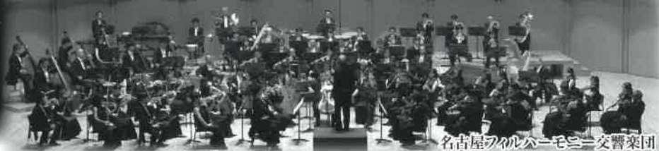
名古屋フィルハーモニー交響楽団