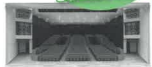
改修後のホールイメージ